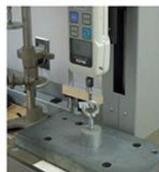
TESTE DE CARGA (DINAMÔMETRO)