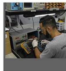
CALIBRAÇÃO/AFERIÇÃO DE EQUIPAMENTOS MAGNÉTICOS, ETC